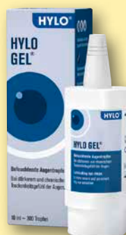
Hylo® Gel Augentropfen 10 ml