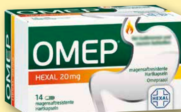
Omepr® Hexal 20 mg 14 magensaftresistente Hartkapseln