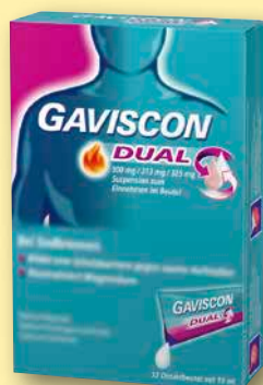
Gaviscon Dual 500 mg/213 mg/325 mg Suspension