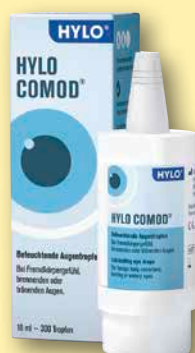
Hylo Comod® Augentropfen 10 ml

Wertvolle Anregungen haben wir im Dezember-Heft auch für Sie, sofern Sie unter kalten Füßen leiden. Und da Weihnachten nicht nur das Fest der Liebe, sondern auch des guten Essens ist, geben wir praktische Tipps, wie der Weihnachtsschmaus ein Genuss für jeden Geschmack wird. Dazu wie immer weitere spannende Hintergrundberichte sowie interessante News aus medizinischer Wissenschaft und Forschung.