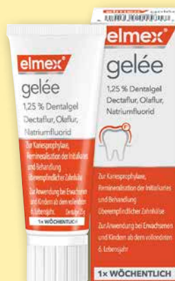
elmex® gelée 25 g