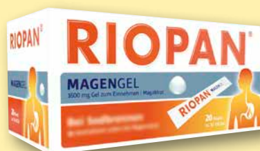
Riopan® MagenGel 20 Beutel à 10 ml

Achten Sie auf weitere Angebote in unserer Apotheke!